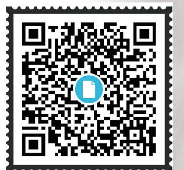
请用微信“扫一扫”功能,扫码观看株洲首次直升机空中救援视频。