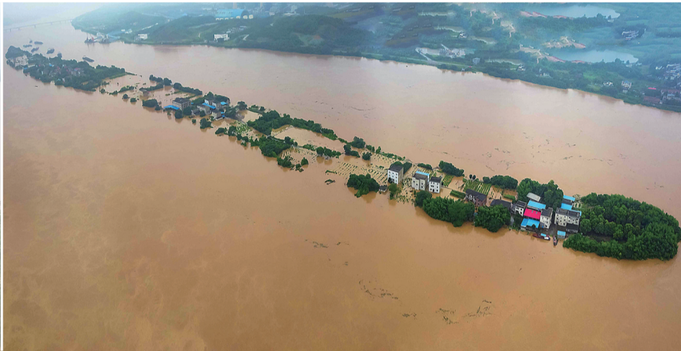
7月9日中午1点,古桑洲几乎快被洪水淹没。