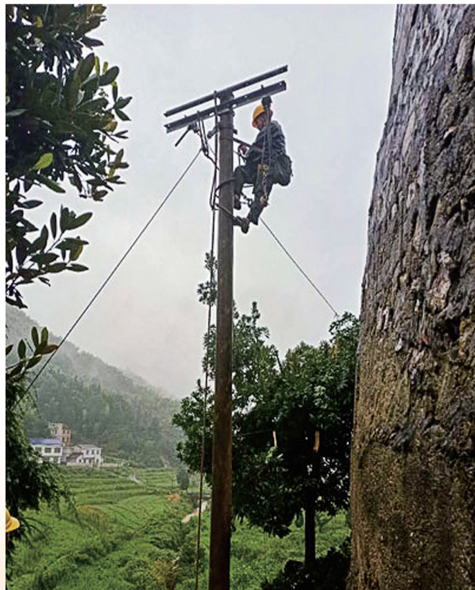
渌口区山体滑坡电线杆,供电公司突击队紧急抢修。