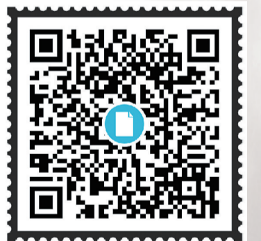
请用微信“扫一扫”功能扫码观看7月9日酒埠江水库开闸泄洪视频。