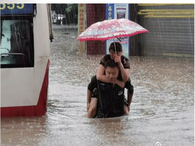
在攸县客运站,一辆班车被困水中,巡特警大队成功将旅客疏散。