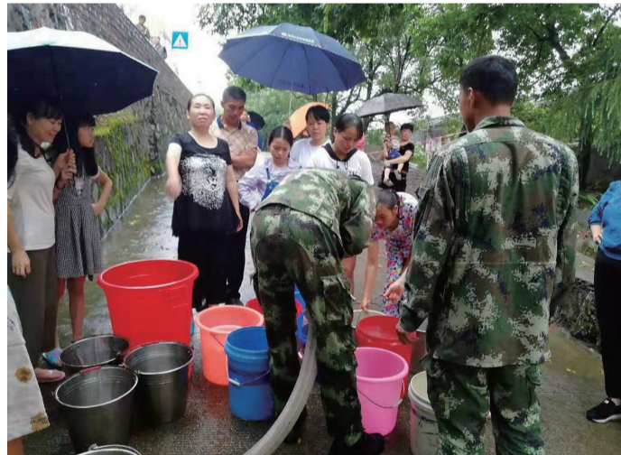
茶陵县云阳街道交通社区因暴雨塌方供水中断,消防员送水解困。谭笑妮 供图