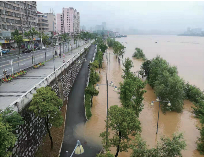
湘江涨水,7月9日下午2时湘江水情图。