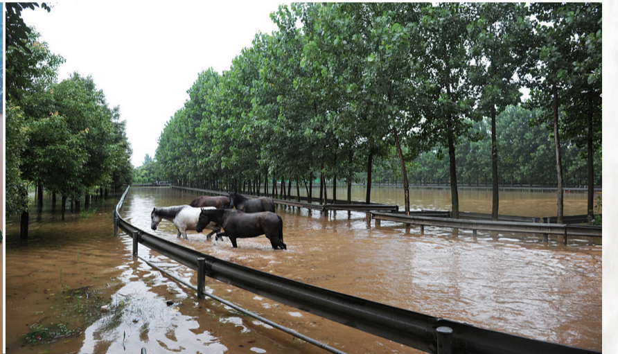
已被淹成一片汪洋的天元区群丰镇悠移庄园马场。