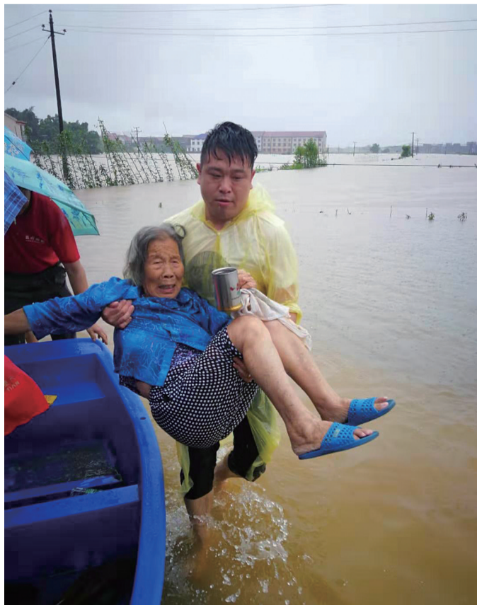
7月9日上午,攸县联星街道七里坪社区干部转移受灾群众。