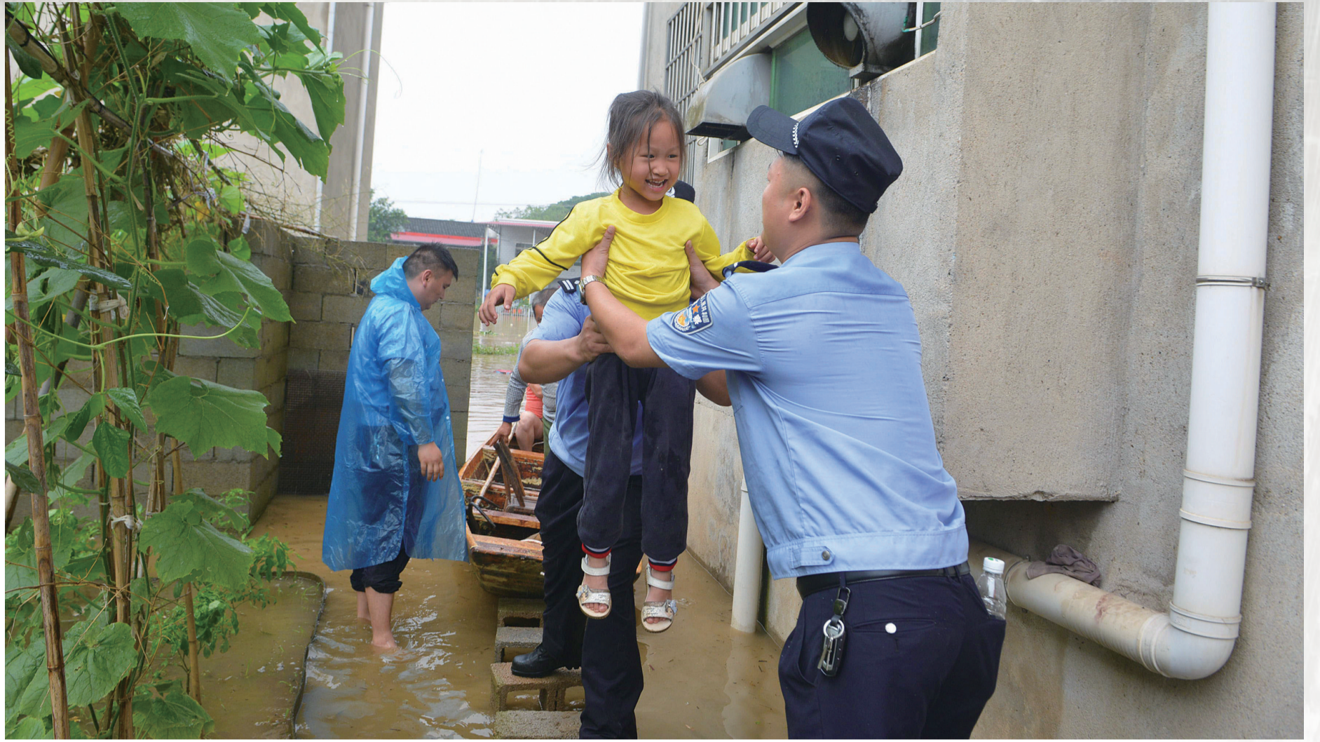
天元区古桑洲救灾现场。