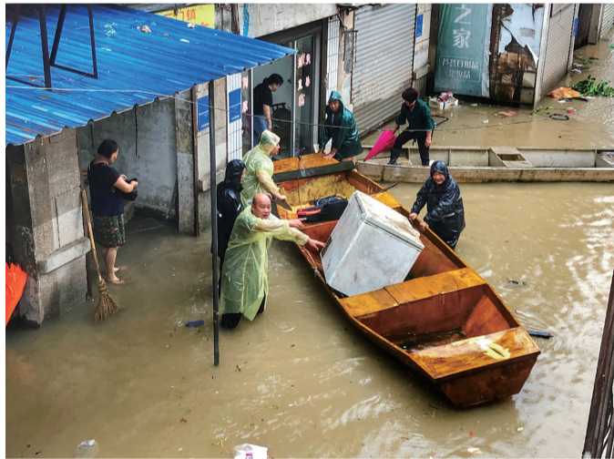
7月9日,天元区三门镇所有机关干部前往老街受灾点进行抢险救灾。