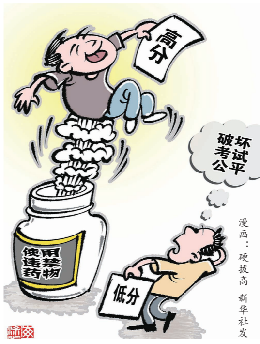
漫画:突破新高 新华社发

卖家称,这些药品都是从国外进口的,在国内正常渠道很难买到。“我卖的都是欧洲正品,是从欧洲走私带回来的,假一赔十。”一位卖家告诉记者,并在微信上发来了药品图片。记者看到,药盒上标注欧洲生产,没有中文标识。