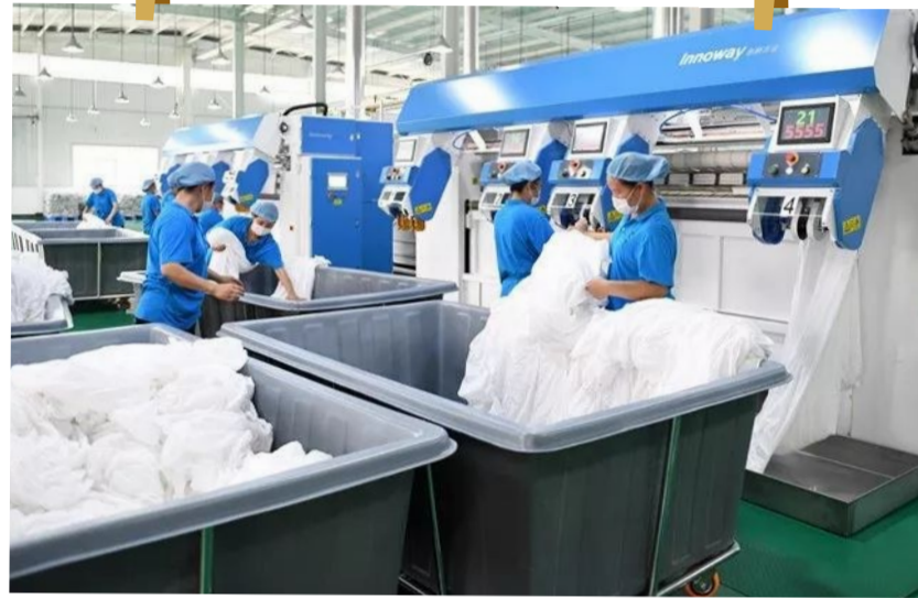
▲武汉首个洗涤绿色基地现场

酒店床单、浴巾到底洗没洗过?有没有落实“一客一换”?近日,武汉首家绿色洗涤基地正式投入运营。这家基地给每一条毛巾、每一张床单都“植入”了芯片,很快还将印上二维码,住店旅客扫码即可获知相关洗涤信息。记者在洗涤基地现场看到,小到毛巾,大到被罩,在其角落都缝制有一个比打火机略小的薄薄的芯片,该芯片防水、耐高温,被缝合在床单、毛巾、浴巾、被罩里后,等于让每一件酒店布草都有了唯一的电子身份证,使得“一客一换”透明化。洗涤厂工作人员介绍,他们正在尝试给所有布草印制二维码,很快就会投入使用。一般传统酒店布草的使用寿命只有两年,布草的洗涤次数只有70到100次。而现在的绿色洗涤设备可以达到150次,通常的情况下,最好的布草最多只能洗250次。为了让用户更好地了解布草的使用情况,目前正在研究百姓放心的布草使用清单,以后每个布草上都有二维码,只需要用手机扫一下布草上的二维码,就可以知道布草的洗涤次数、使用情况以及布草的好坏。