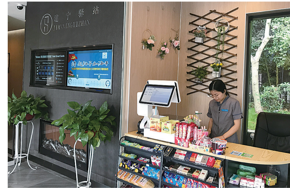
▲湖南铁路科技职业技术学院附近的建宁驿站内,增加了花卉等装饰