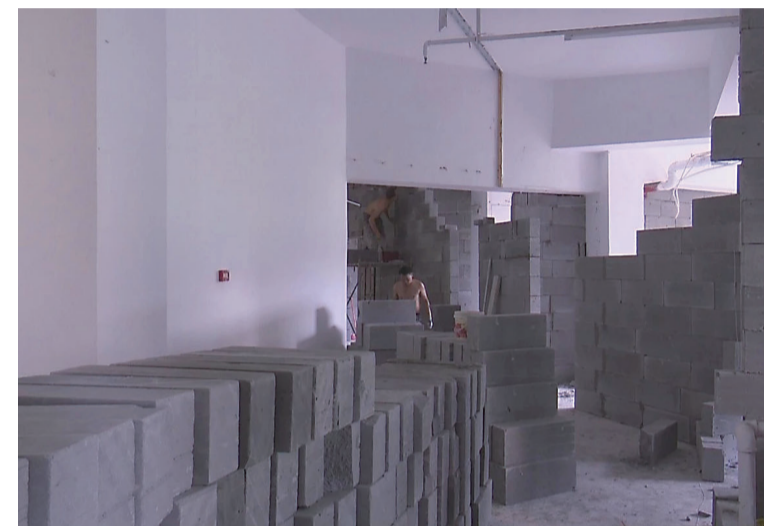
▲市长热线办督办员现场检查时,宾馆正在进行装修

本报讯(记者 陈驰)前几天,芦淞区君逸康和小区数名居民致电市长热线反映,有人要在小区三楼开宾馆,在没有任何审批手续的情况下,已经开始装修了,希望相关部门介入调查。