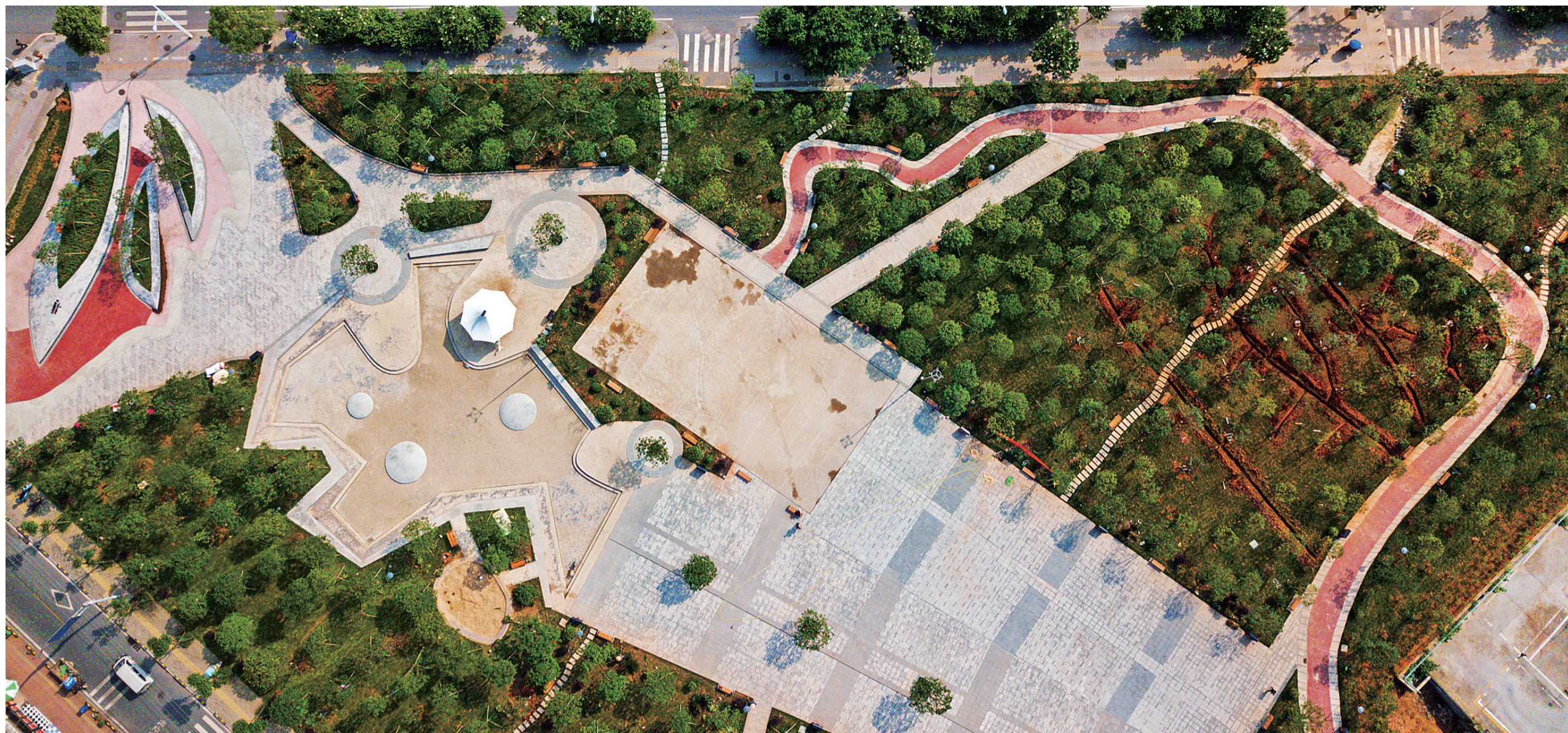
清水塘广场,是石峰区“美丽社区”建设项目,满足了附近杨梅塘社区等社区居民多方面需求。