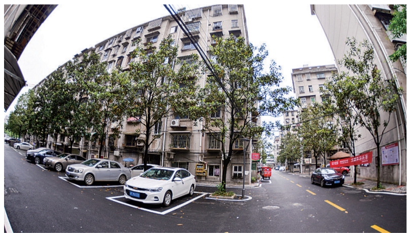
天元区花园一村等一批老旧无物业管理小区改造后,环境大变样。