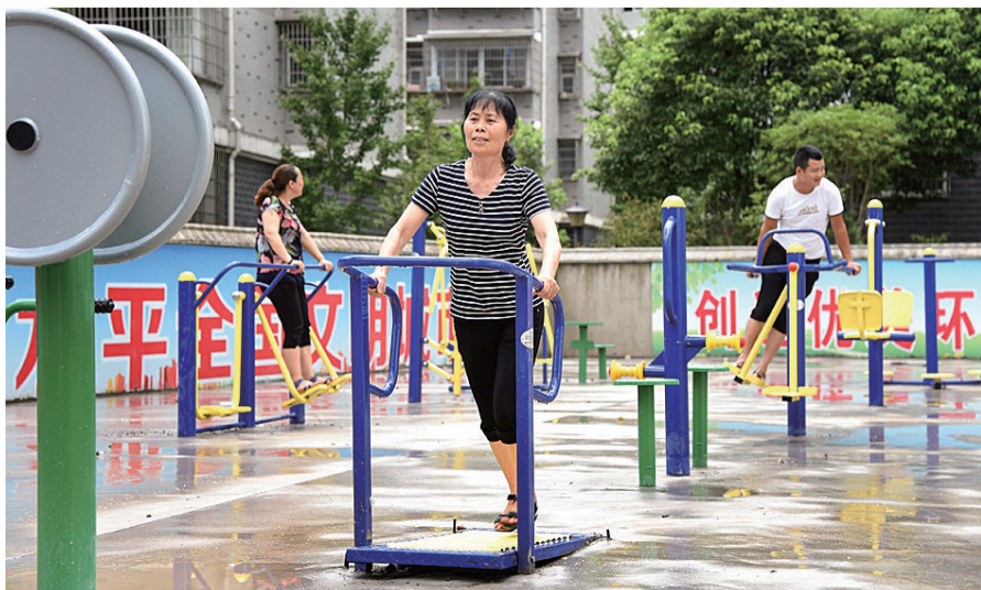
云龙示范区云田镇莲花社区里,社区居民在健身器材上锻炼。