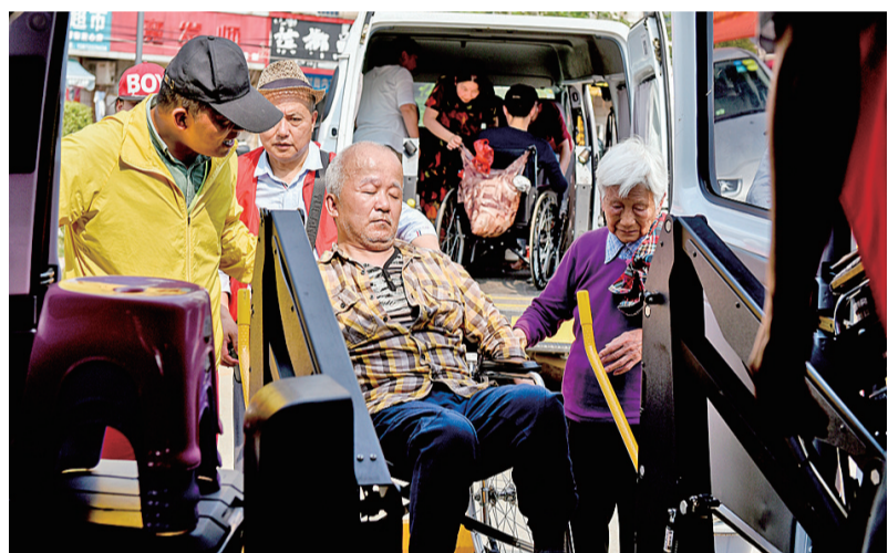
石峰区井塘社区、先锋社区等多个社区的残疾居民,享受免费居家托养服务。