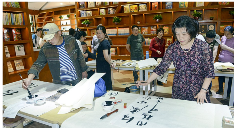
天元区小湖塘社区里的嵩山文体活动中心,成为周围居民的文化休闲好去处。