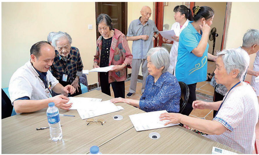
云龙示范区龙头铺卫生院,在三塘桥社区开展家庭医生签约服务活动。