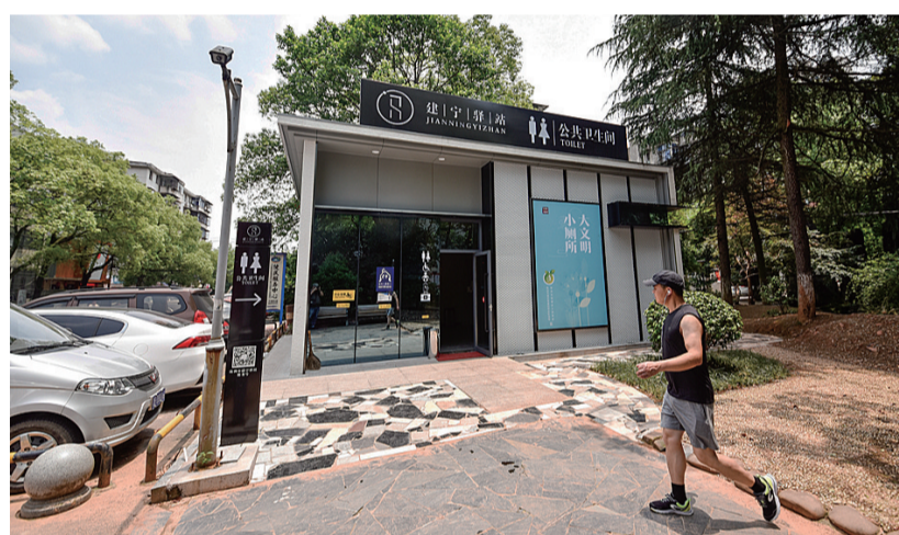
荷塘区袁家湾社区中南小区,年初建好的建宁驿站极大方便了周围居民。