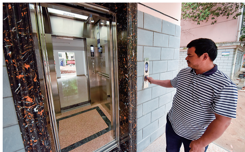
在天元区法院小区,新加装的电梯方便了小区里的老年居民上下楼。