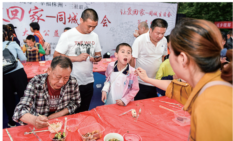
石峰区沈家湾、花果山两个社区的居民为社区里的空巢老人、留守儿童等特殊群体过集体生日。