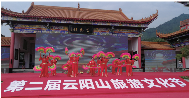
来自湘潭边界的广场舞队尽情地表演舞蹈。