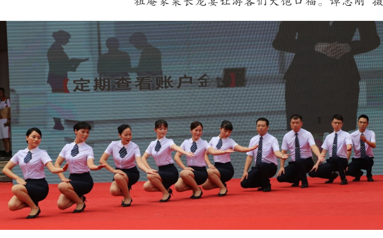
茶陵农商行《最美农商人》礼仪秀展现县域金融主力军的风采。