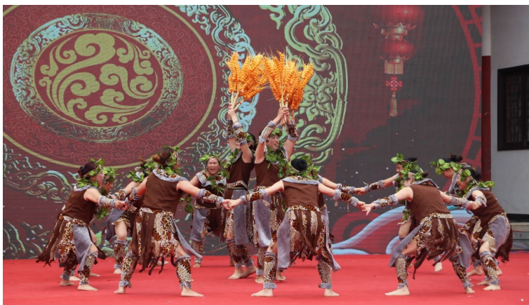
省级非物质文化遗产《祈丰舞》表演拉开了旅游文化节的序幕。