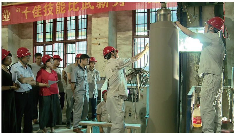
图为电瓷电器组比赛现场。