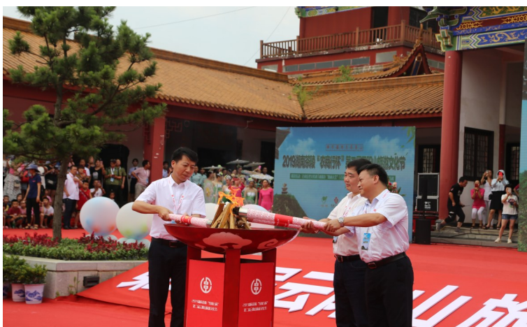
领导们从火炬手中接过火种点燃圣火。