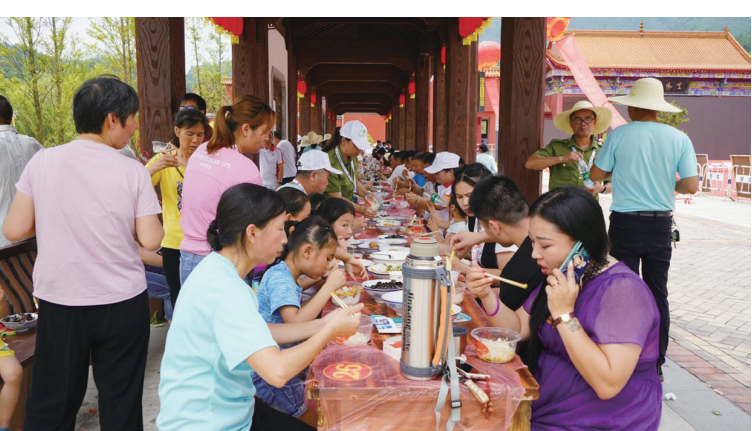
祖庵家菜长龙宴让游客们大饱口福。