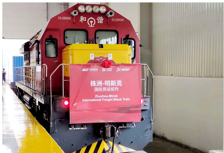
▲中欧(株洲)国际货运班列发车现场