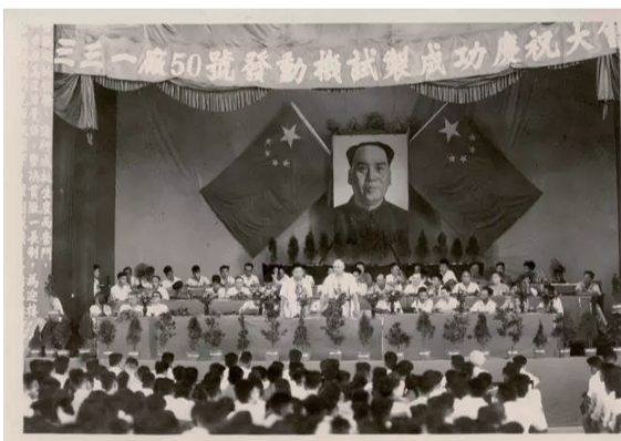
1954年8月26日，331厂举行试制成功庆祝大会。