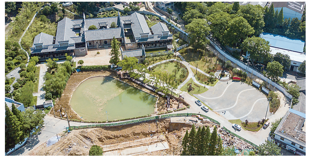
▲改造后的秋瑾故居航拍图