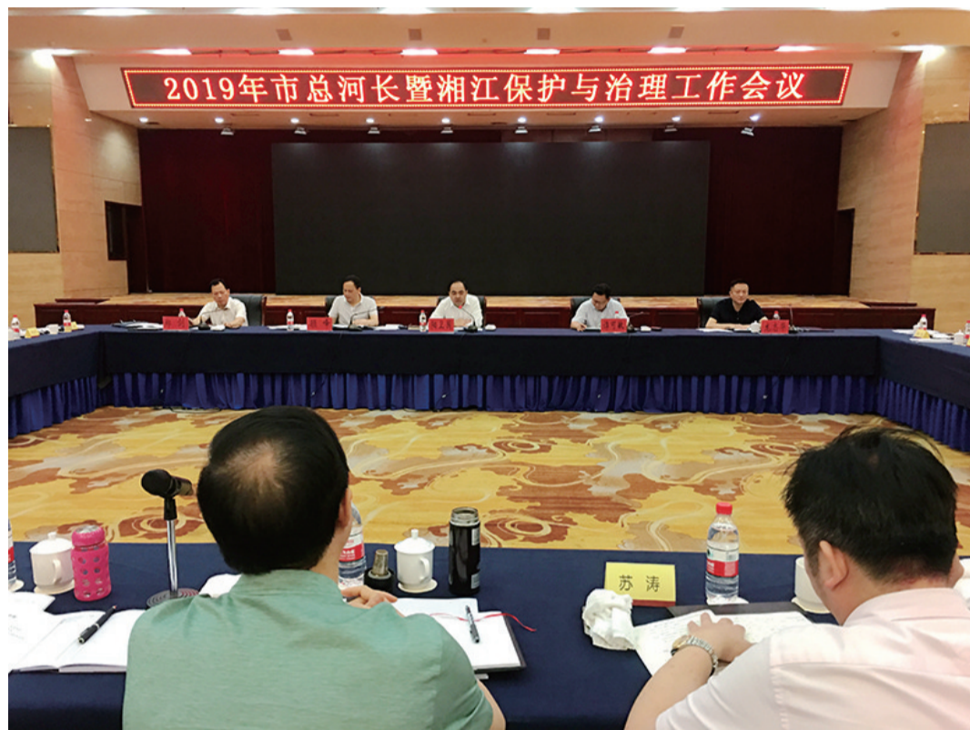
▲全市总河长暨湘江保护治理会议现场

存在同样现象的还有位于茶陵县舂舂乡西岸村沱江河畔的河坞采砂场,经营许可证到期后,现场仍存大量机械设备和砂石。