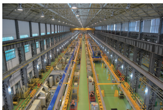
▲2014年改造一新的总成车间 中车株机党委宣传部提供