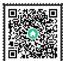
扫二维码看报道视频 视频剪辑/唐剑华 摄像/谭浩瀚

如今,株洲电力机车、城轨等产品出口世界四大洲70多个国家和地区,电力机车产品占据全球市场的20%。通过“输出产品+服务+技术+投资+制造”的模式创新,中车株机产品成为中国制造“走出去”的代表作,成为享誉世界的“中国名片”。