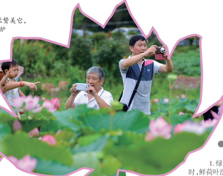
▲市民在荷塘区仙庾镇拍摄荷花