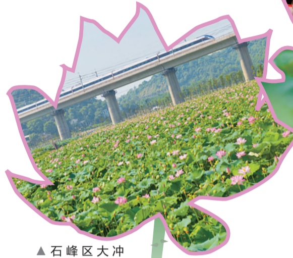
▲石峰区大冲村,城铁从荷花池边驶过(资料图)

这个时节,荷塘翠绿、荷叶田田、荷花依依,美不胜收。在城区就能赏荷消暑,做几款与荷相关的美食、咏诵荷花的经典诗句,这才是盛夏的正确打开方式。