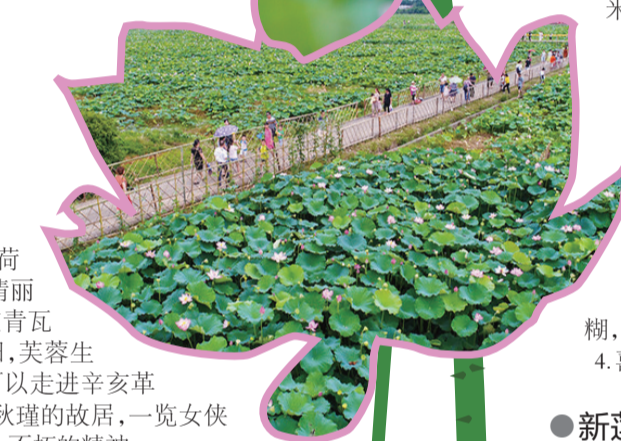
▲在仙庾镇赏荷的市民