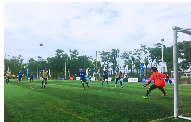
▲湖南媒体足球邀请赛决赛场景

本报讯(记者 戴凇)近日,裕天国际·2019湖南媒体足球邀请赛落下帷幕。在决赛的点球大战中,长沙税务\株洲媒体联队惜败于体产协会\红网联队,获得亚军。