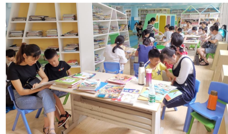
▲市图书馆少儿阅览室里人气高

本报讯(记者 肖蓉 通讯员 严丹)昨日,记者从市图书馆获悉,暑假期间,为满足市民特别是孩子们的书籍借阅需求,市图书馆将在暑假期间调整开放时间,除以往的常规时间外,周二及节假日也将正常对外开放。