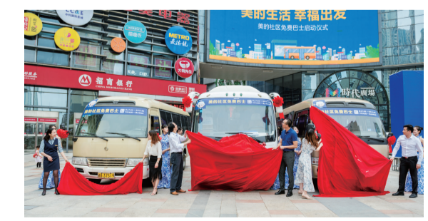
▲美的社区免费巴士揭幕

美的社区巴士经由美的时代广场、美的城、美的蓝溪谷、佳兆业、湖景名城、白鹤小学栗雨分校(早晚班),具体路线为美的时代广场——美的城2号门——美的城1号门——美的城8号门——美的城7号门——美的蓝溪谷6号门——美的蓝溪谷2号门——美的蓝溪谷售楼部——美的蓝溪谷9号门——来来集市——白鹤小学栗雨分校(早晚各一次)——上橙小院——佳兆业二期——湖景名城——美的时代广场。