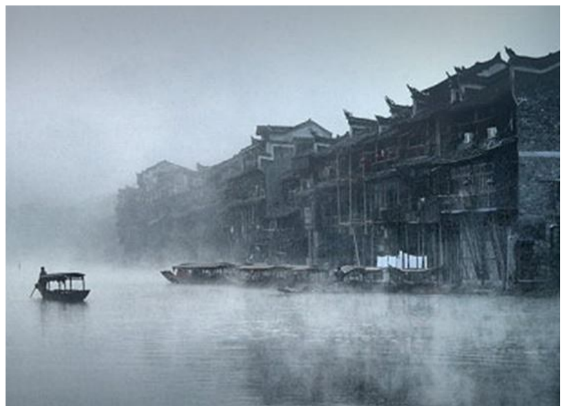
烟雨朦胧的江南。来自网络

“黄梅时节家家雨,青草池塘处处蛙。有约不来过夜半,闲敲棋子落灯花。”这首黄梅诗词压轴之作《约客》的主人并非李杜、苏辛这样的大家,而是一个不太知名的诗人赵师秀,上半阙寥寥四字勾勒出一幅雨声不断、蛙声一片的江南梅雨图,下半阙诗人久候客人不至,内心焦躁“闲敲棋子”,这种失落的心情形神兼备跃然纸上,全诗几乎不加任何修饰,纯用白描手法,却隽永蕴藉,耐人回味。