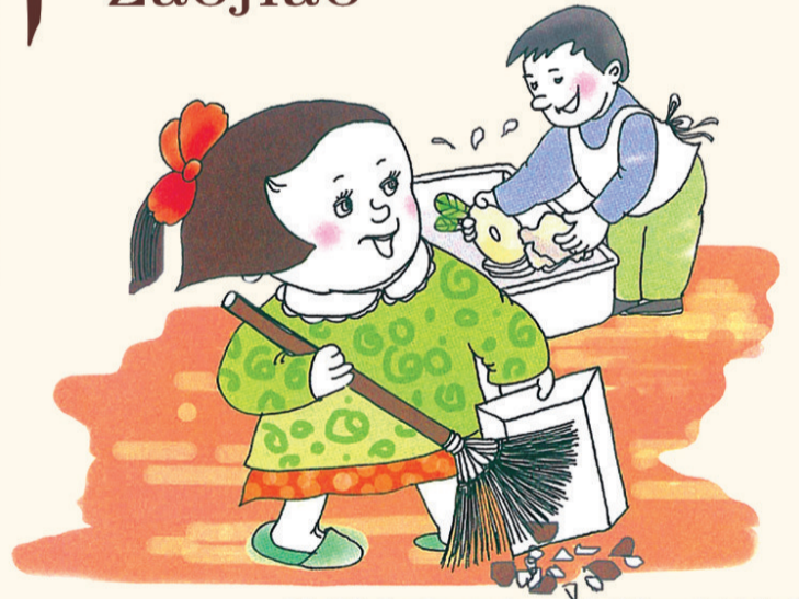
株洲市文明办 株洲日报社宣