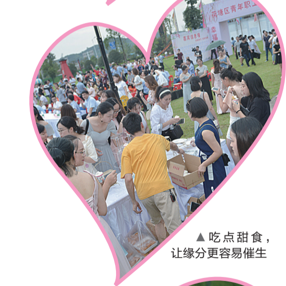
▲吃点甜食，让缘分更容易催生