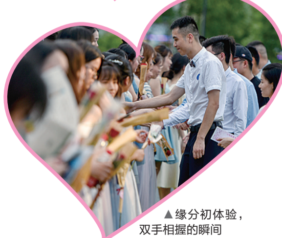
▲缘分初体验，双手相握的瞬间