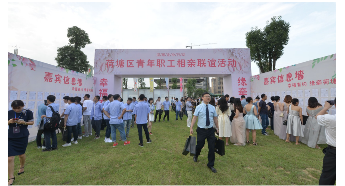
▲男女单身青年入场签到，查看相亲信息