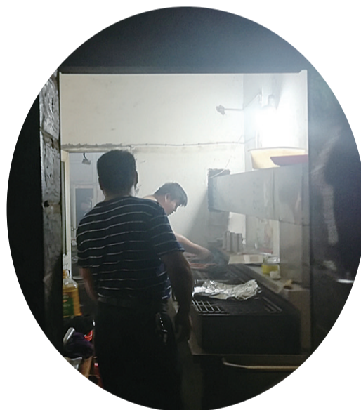
▲执法人员找到气味的源头

近段时间，一阵阵悄然来袭的臭味引起石峰区田心街道泉塘湾小区7栋很多居民的猜测，像是焚烧垃圾，或是电线老化起火。