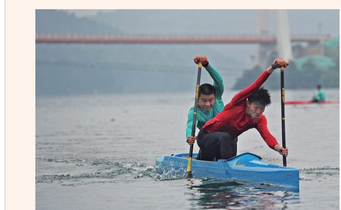
男子双人划艇训练。