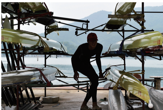
科学的训练使得这些学员都拥有着良好的身型,障碍中穿行起来犹如蜘蛛侠般的轻快。