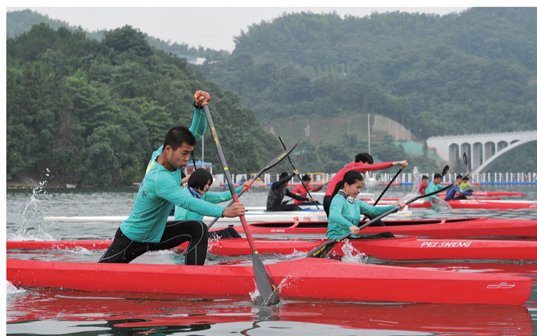
皮划艇运动与传统的“划龙舟”比赛比较相似。