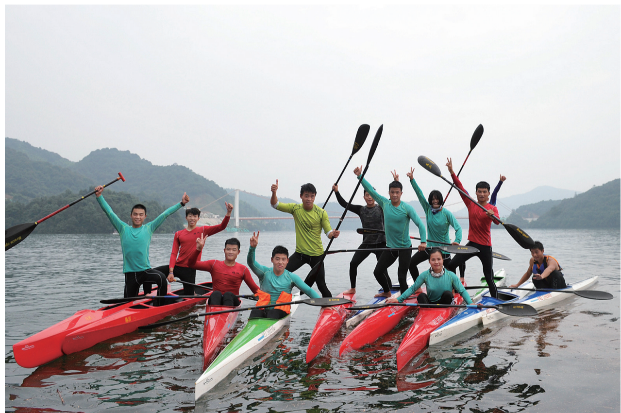
结束一天训练的学员们来了张大合影。