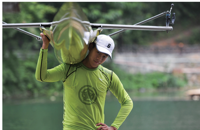
由碳纤维等复合材料制造而成的一个单人桨艇,重量大致在15公斤左右。