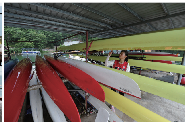
日常训练过后,队员在仔细检查着自己的皮划艇。