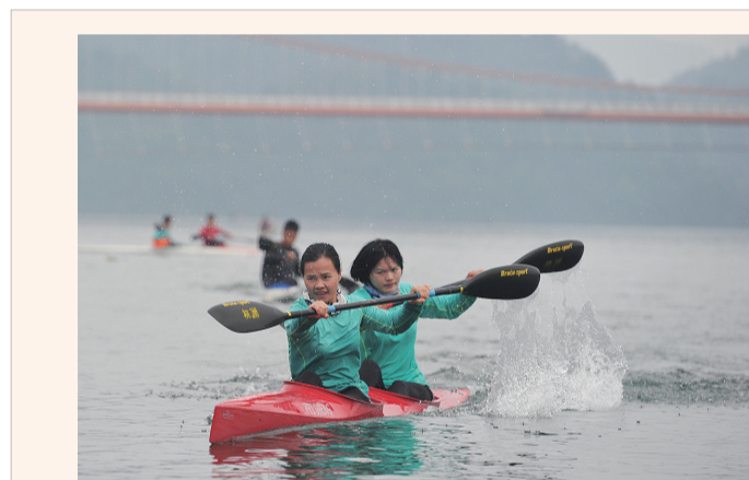
女子双人皮艇训练。