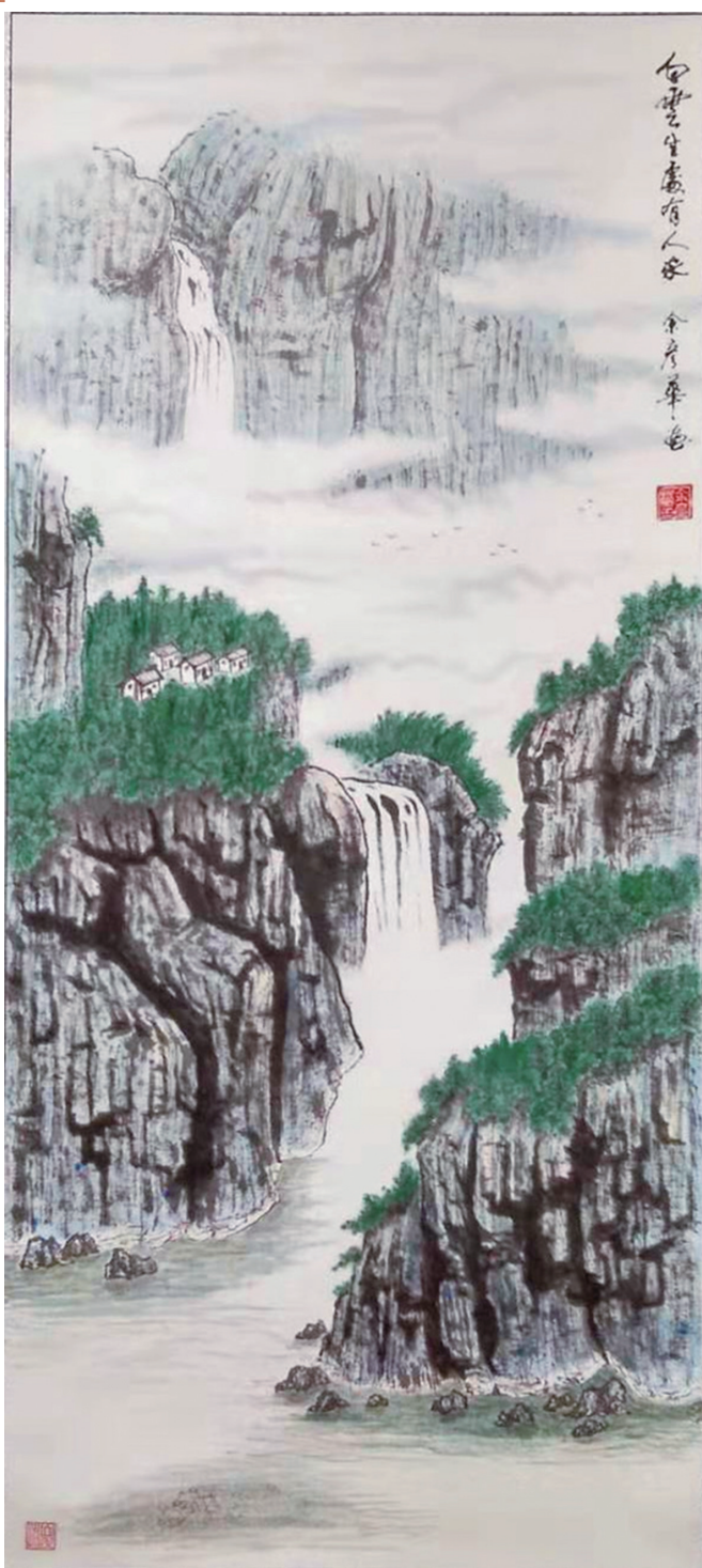
(作者:余彦华 74岁 芦淞区煤田小区)