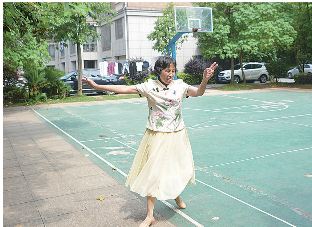
▲黎阿姨在回忆当年跳过的舞蹈时,情不自禁的跳了起来