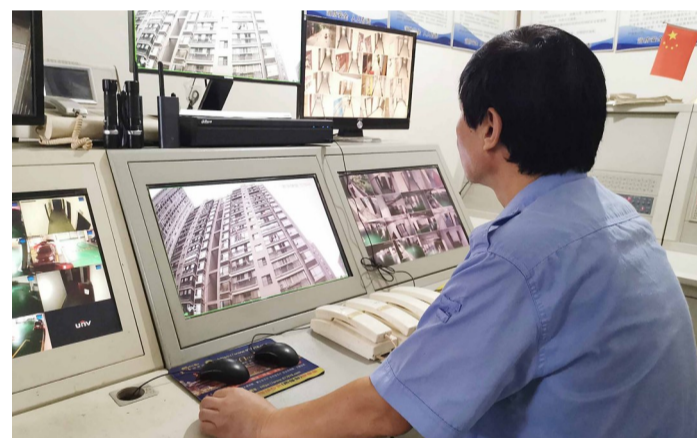
▲物管工作人员正在调试监控