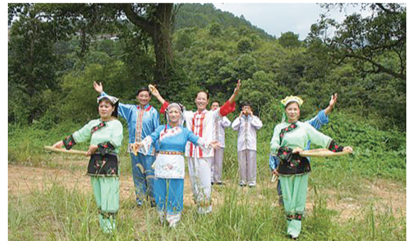
客家人正在演唱山歌