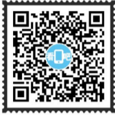
(视频/茶陵县宣传部)

茶陵县卧龙村,山奇水秀,古树参天。境内的泰和仙,群峰挺拔,各具其秀,山下林木繁茂,山上灌木丛生,山顶云雾升腾,方圆百里有72座山峰、12涧溪、5深洞,自然资源十分丰富,是中国最美休闲乡村、国家3A级旅游景区。卧龙村建于唐代的泰和仙道观,石墙铁瓦,古朴坚实,久闻盛名。卧龙沟长12公里,沟内溪流潺潺,山环水绕,涓涓细流清澈透明。泉水击石,淙淙作响。卧龙沟旁南竹海一碧万顷,清风徐来,竹影婆娑,竹叶沙沙,宛如天籁。用手机微信“扫一扫”功能扫码视频,看看茶陵美丽的卧龙客家小山村。