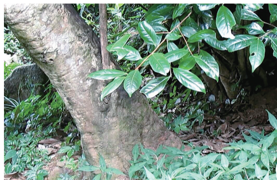
千年古树树粗大的树干。