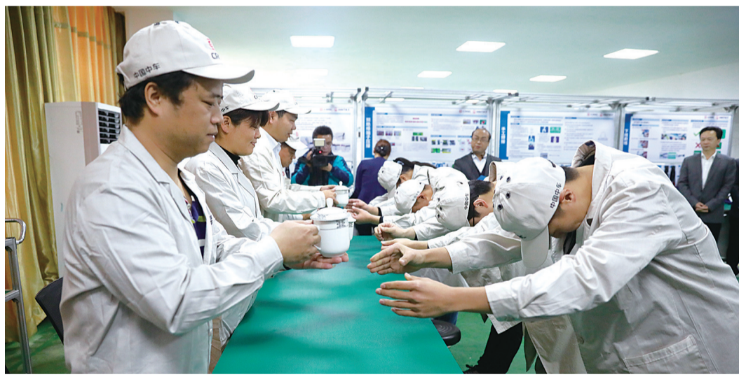
国际电气培训中心新型学徒制试点班学生拜师敬茶。

“企业求贤若渴,求职者‘望眼欲穿’,高级蓝领可遇不可求。”市人力资源服务中心相关负责人认为,究其原因在于,近年来,我市加快推行产业转型升级,搬迁关停了一大批老旧工业企业,转而发展轨道交通、航空、电子信息、新能源等新兴产业。而大批搬迁企业遗留了大量下岗人员,因其年龄偏大,技能掌握单一,再就业增加了一定困难。