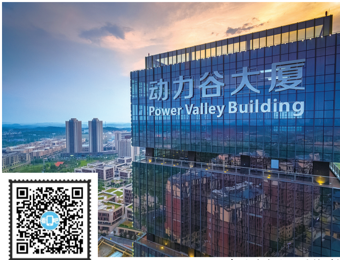
中国动力谷。

用手机微信“扫一扫”功能扫码观看视频,了解株洲高新区从轨道交通等传统先进装备制造,到新材料、电子信息等新兴产业,从株洲高新区产出的高技术产品,成功进入世界一流梯队的故事。(文/唐剑华 视频/株洲市广播电视台)