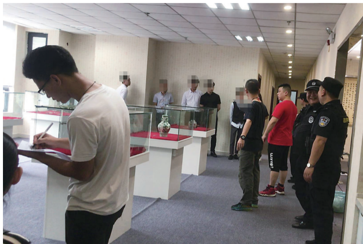
▲专案组民警抓捕嫌犯

本报讯(记者 陈驰 通讯员 周洁 田虹)打着高价收购藏品的幌子并设下“套中套”,致使140余人被骗300多万元。近日,天元公安分局民警破获了一起特大网络诈骗案。