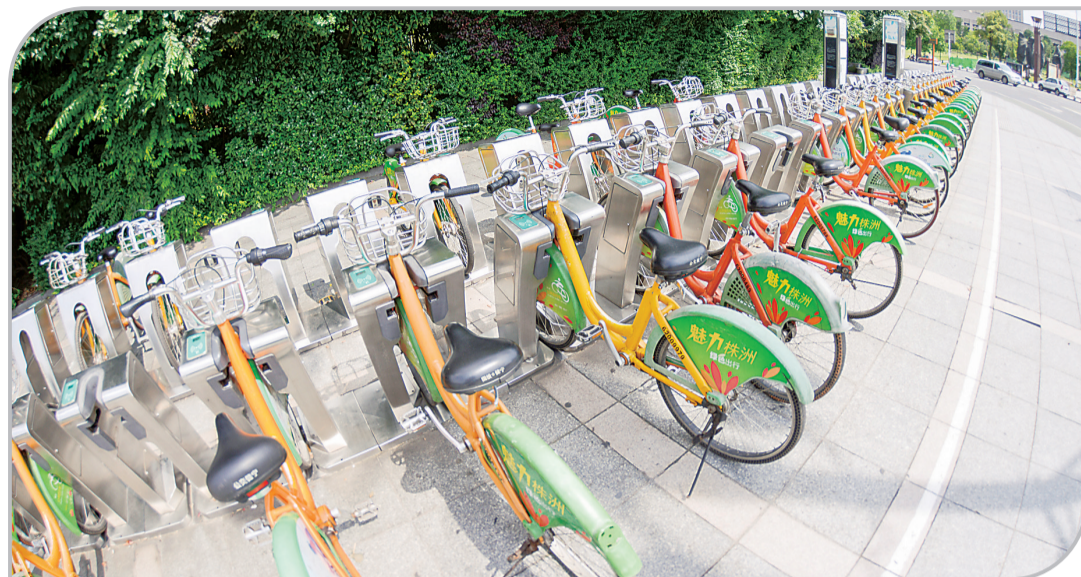
▲城区一处公共自行车存取点

株洲公共自行车运行8年多了,这种低碳环保又便宜的出行方式受到广大市民欢迎。看似矛盾的是,运行8年来,市民的骑行量却大幅下降了300万人次。这一现象也引发了众多市民关注与讨论。(详见本报6月4日A06版)