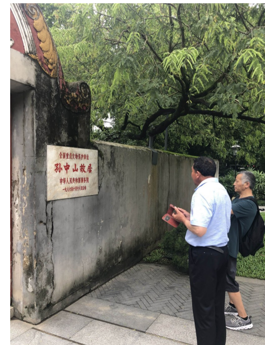
▲读者参观孙中山故居