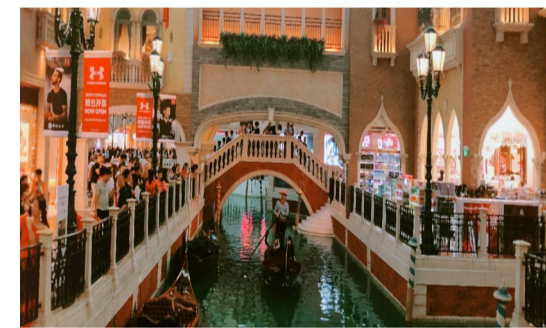
▲澳门威尼斯人娱乐城

读者张阿姨这次是一个人参加的活动,对这次旅行她还是比较满意的。旅行途中,张阿姨告诉记者:“本来约了朋友一起,结果对方临时有事参加不了,因为是报社组织的,出于信赖晚报,我就还是大着胆子参加了。”张阿姨还表示,以前一直照顾家里老人,没怎么出来旅行过,现在自己年纪也逐渐大了,想多出来走走,下次有适合的线路,还是会选择跟着晚报一起旅行。(文/图 唐艳)