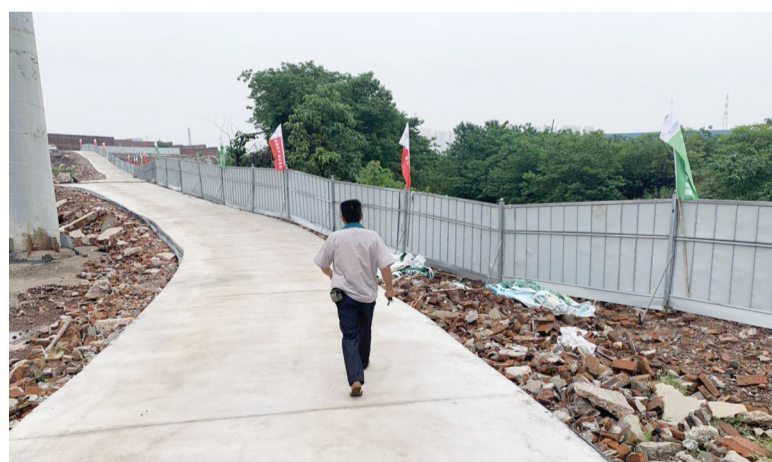
▲粮先生说,工地右侧护栏是他们负责运输的

“工友们现在天天找我要工资。”粮先生告诉记者,上个月,他受雇在清水塘大道工地从事护栏围挡的运输工作,由于工作比较多,他叫上了4个工友,5个人一起在工地上工作了10多天。起初工资都是每日结算,但是工期后半段改成每两天一结算。最后护栏施工完毕了,最后2天的工钱却没有结算。