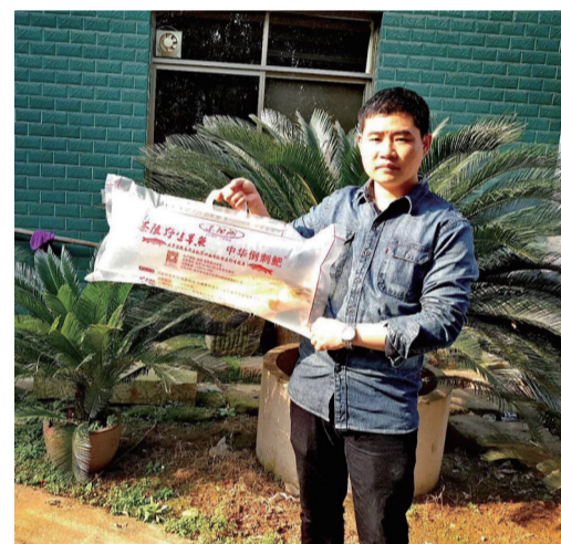
礼品装的中华倒刺鲃受到市场欢迎。

功夫不负有心人，经过3年的养殖周期，投放的中华倒刺鲃平均长到每尾2斤左右，大的长到5斤多重。为提高知名度，我注册了“东阳湖”商标，同时与科研单位合作，开展中华倒刺鲃苗种繁育、鱼种培育研究。截至目前，岩口水库开始出现大量的自然繁殖鱼苗，每年渔获之余，中华倒刺鲃仍保持在4万多尾。