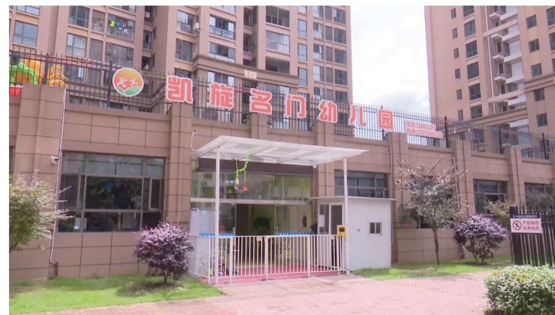
▲幼儿园与2栋架空层连成一片