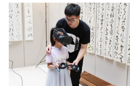
▲一名小学生戴着VR眼镜体验写字和书法之美

本报讯(记者 何春林 通讯员 陈芹)昨天上午,全国首届“书法·设计与生活”展演在湖南工业大学开幕。据介绍,此次展演是国内首次以书法契合于生活和设计之中的现代展览与论坛,有较多创新的展示作品和视觉惊喜。