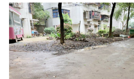
▲小区内枯枝败叶无人打扫

几天前,任先生拨打晚报新闻热线28829110反映:我居住在天元区邮政小区,现在小区环境“脏乱差”,影响居民生活,希望有关部门能对小区进行提质改造。