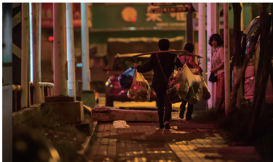
6:00 过来买菜的市民满载而归。