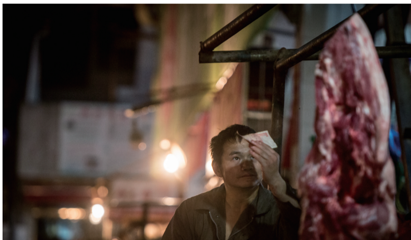
3:30 刚收到的货款,必须仔仔细细看清楚。