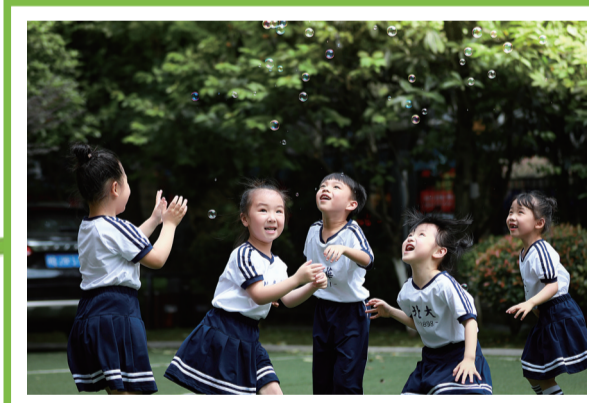
我们吹的泡泡超级高。