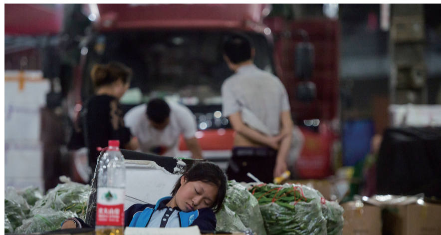
4:00 实在太累,也只能靠在椅子上睡一会。