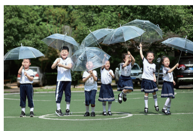
雨伞就是我们的降落伞。