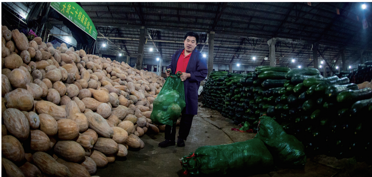
2:00 刚到的货物被整整齐齐堆放在一起。