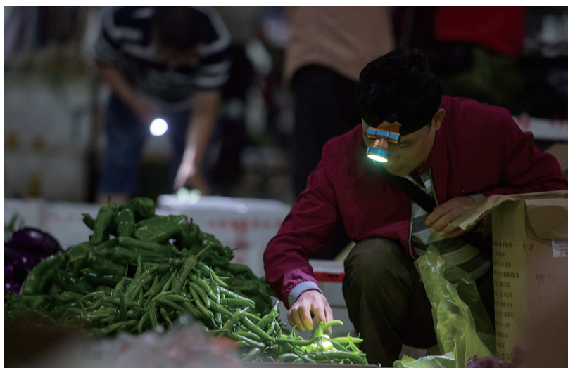
5:00 天还没亮,市民全副武装过来挑菜。