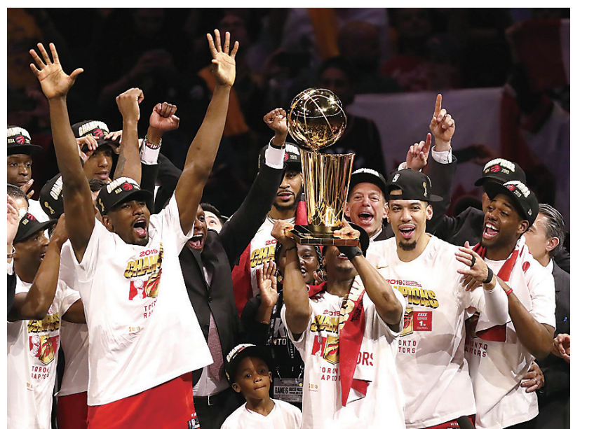
6月13日,猛龙队球员在颁奖仪式上。

据《新民晚报》 两周前,鲜有人能笃定地预测到,金州勇士的王朝,会被一支非美国本土球队终结。北京时间6月14日上午11时48分,多伦多猛龙在勇士主场甲骨文球馆以114比110战胜勇士,以4比2的总比分夺得总冠军,创造了NBA成立73年来首支非美国本土球队夺得冠军的纪录。