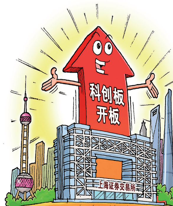
漫画:科创板开板

“设立科创板并试点注册制,是深化资本市场改革开放的基础制度安排,是推进金融供给侧结构性改革、促进科技与资本深度融合、引领经济发展向创新驱动转型的重大举措。”证监会主席易会满在陆家嘴论坛上说,将坚持以增量改革带动存量改革,充分发挥科创板的改革试验田作用,形成可复制、可推广的经验,以此带动资本市场全面深化改革,努力打造一个规范、透明、开放、有活力、有韧性的资本市场。