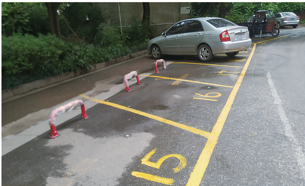
▲玫瑰名城二期10栋楼下私划的停车位和私设的地锁

昨日,荷塘区玫瑰名城二期有业主拨打晚报新闻热线28829110反映:我们二期10栋的业主在楼下马路边私自划了停车位,还装上地锁,将公共区域占为己有,当成私家停车位。