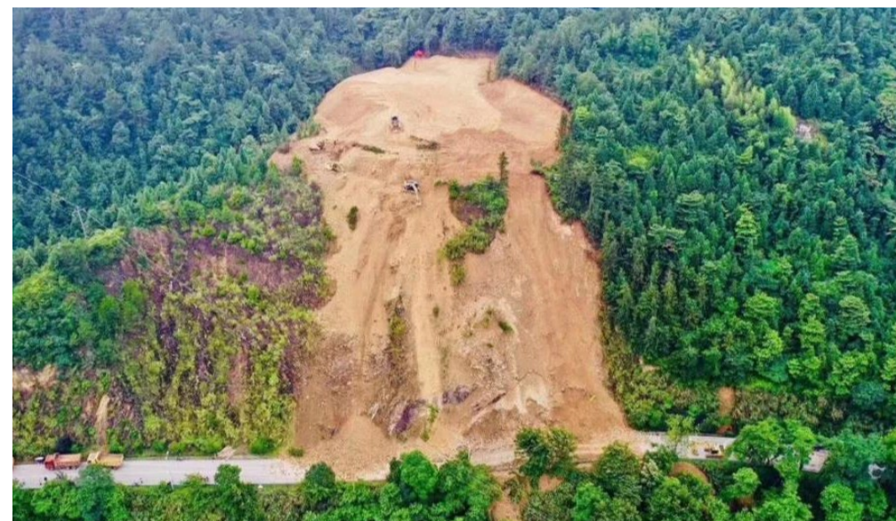
▲相关部门正加紧抢修

本报讯(记者 戴灏 通讯员 谷经华)因大雨造成山体滑坡,106国道炎陵老造纸厂路段通行受阻。记者昨日获悉,目前,交通公路部门正加紧对道路及山体进行抢修,但过往车辆需要通过高速公路绕行。