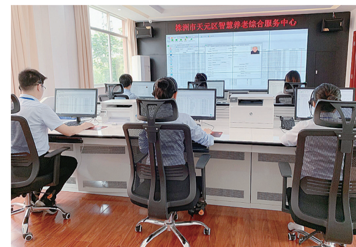
▲在大数据中心里,话务员接听12349养老服务热线

在智能生活体验区里,不少老人对陈列的“小物件”很感兴趣,猜测着它们的功用。“这个安全预警器(定位手机、传感手环)可随时对您进行精准定位,并实现跌倒判断自动呼叫功能,一旦老人出现突发状况,子女或服务中心都会及时收到呼叫信号;智能门磁探测器则可提醒独居老人是否忘记关门窗;这款智能监测传感带,能感应到老人的睡眠状态及生命体征指数并同步传递到子女的手机上。”工作人员一边解说,一边让老人们试戴、体验。