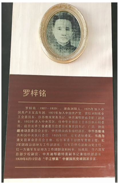
挂在遵义县革命委员会旧址里的罗梓铭像和简介。