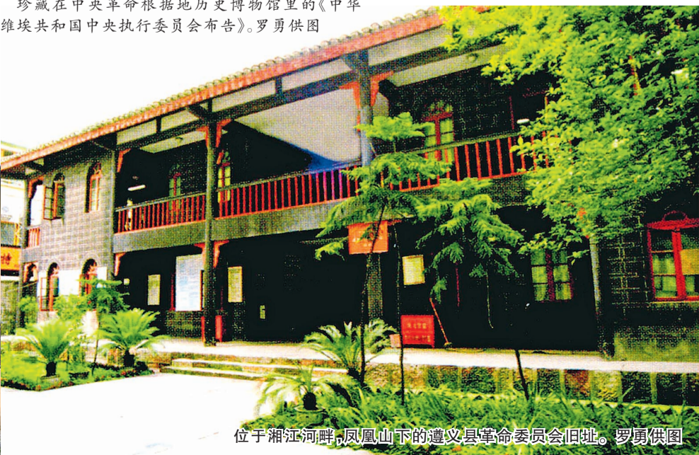
位于湘江河畔，凤凰山下的遵义县革命委员会旧址。