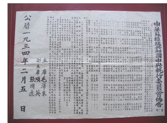
珍藏在中央革命根据地历史博物馆里的《中华苏维埃共和国中央执行委员会布告》。