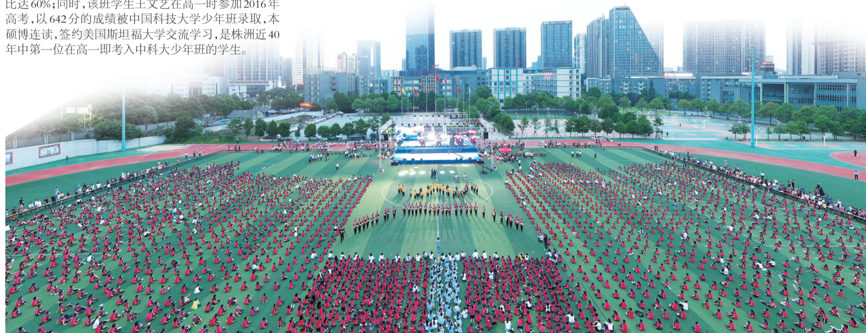
▲学校七千师生共同参与的大型活动,总会“霸屏”株洲人的朋友圈

办学十四年,北师大株洲附校在固执与坚持中,培养出了一批批具有株洲精神、中国情怀、世界意识、宇宙眼光的四维视野的新时代人才,学校也向着“有优势、有特色、有影响、有品牌的三湘名校”的目标阔步前进。