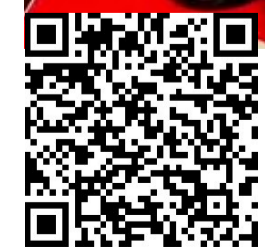
◀扫码可观看骗术揭秘视频