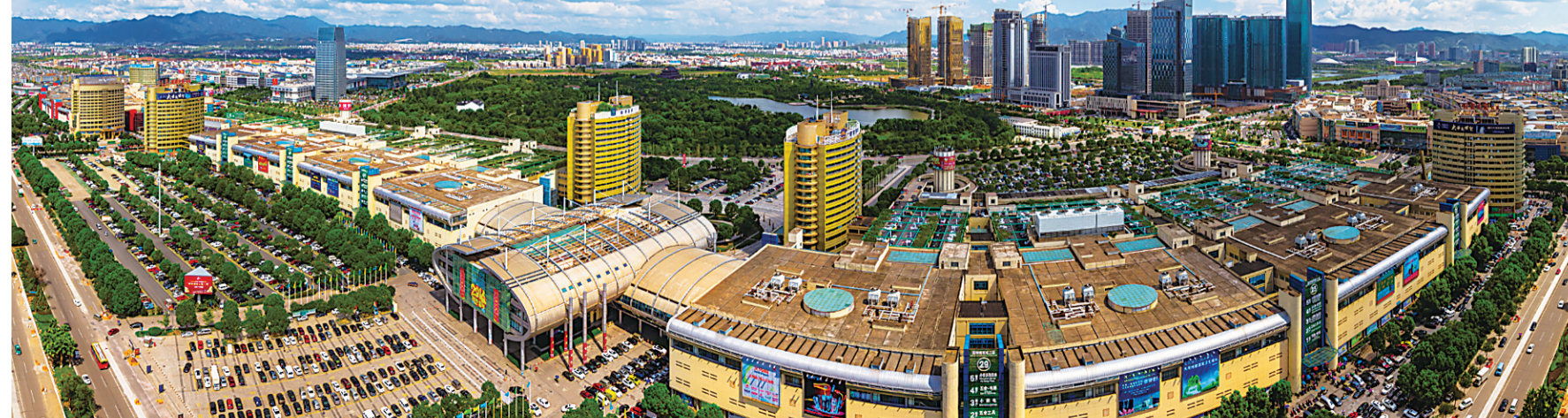
▲义乌国际商贸城全景

如今,每年到义乌采购的境外客商超过50万人次,有100多个国家和地区的1.5万多名境外客商常驻义乌,商品出口到世界219个国家和地区,市场外向度达65%以上。