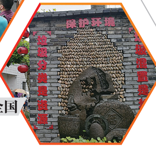
▲垃圾分类在金华已深入人心

如何破解这道难题,金东区给出了接地气的方案:市民向农民学习,借鉴之前的农村“两次四分法”,推出“两定六分法”。“两定四分法”,也就是农户把垃圾按“会