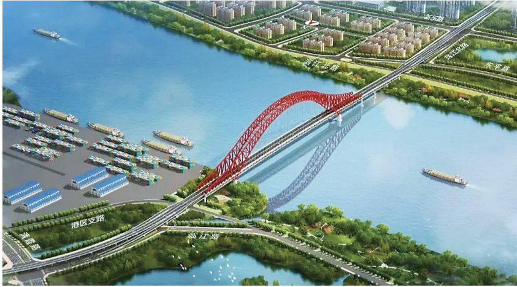
▲清水塘大桥效果图(资料图)

近日,市发改委批复清水塘大桥新建工程可行性研究报告,同意株洲中交清水塘投资开发有限公司作为项目业主,按照城市规划及土地利用规划组织实施株洲市清水塘大桥新建工程项目。项目建设工期为36个月,总投资约15亿元。项目建设的地点位于石峰区和天元区,项目主要建设内容为新建桥梁、道路、排水、照明、景观、交通设施及附属工程等。清水塘大桥北起清水塘大道,上跨清霞路,往南越过湘江,上跨滨江北路、新东路后对接珠江北路落地,道路全长2.85公里,其中桥梁段长度2.175公里。主跨桥梁采用双层钢桁架拱桥结构,跨径408米。桥梁上层为机动车道,净宽31米,双向6车