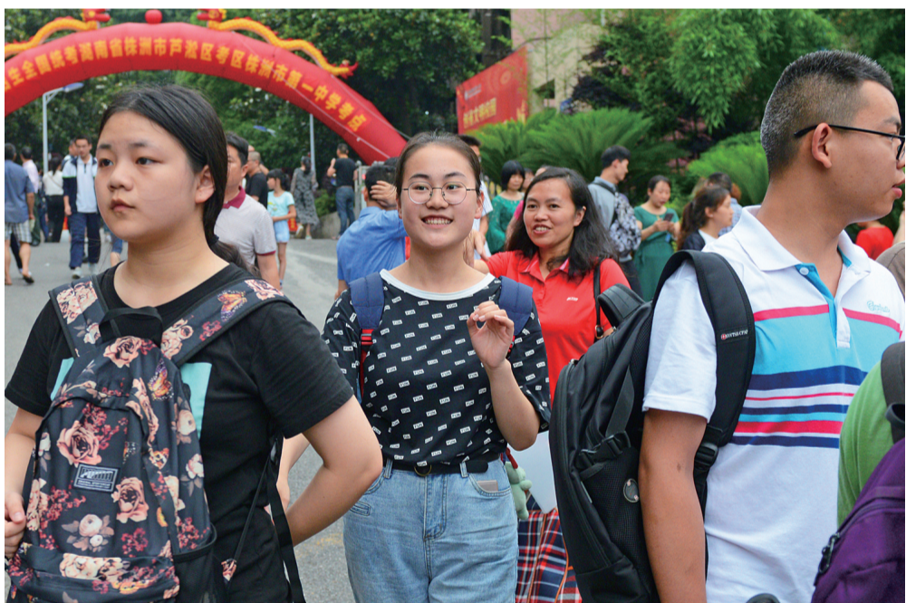
6月8日下午5时15分左右,高考株洲市第一中学考点,考生们完成高考最后一门英语考试走出考场。