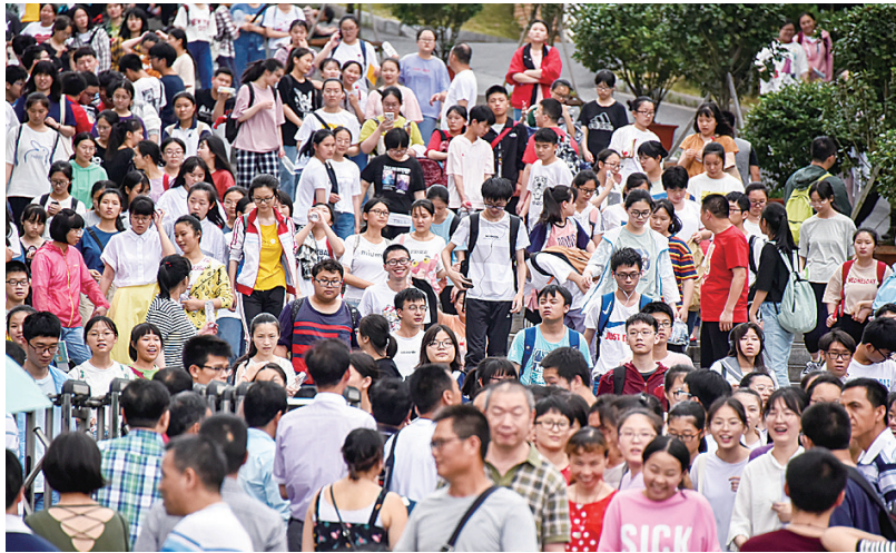
▲6月8日,在市十三中考点,结束考试后的考生走出考场

昨天下午,全市19639名考生递交了答卷并走出考场,这意味着我市2019年高考顺利结束。