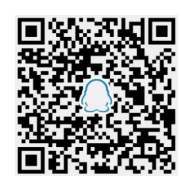
▲晚报乐活周刊QQ读者群

特别提醒:本刊登载的文章、美术作品均有稿酬(纸质版、电子版、微信版稿酬合一),凡未收到稿酬的作者,请与本刊编辑部联系。作者如无特殊声明,即视为同意授予本刊及本刊合作网站信息网络传播权,本刊支付的稿酬包括此项授权的收入。