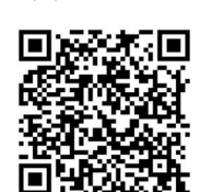
▲晚报乐活周刊微信群