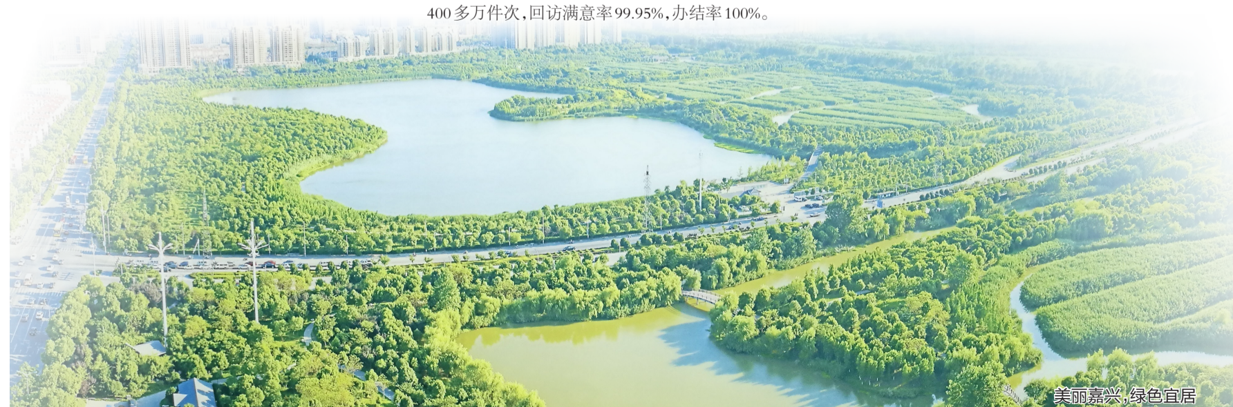
美丽嘉兴,绿色宜居

在一些“老字号”发展受阻、停滞不前甚至面临消失的今天,传承近百年的“五芳斋”历久弥新,不断壮大,年销售额达到24.4亿元,堪称奇迹。