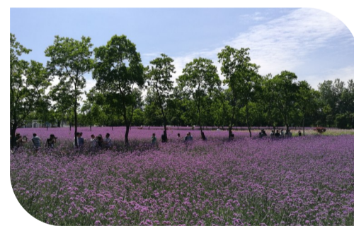
▲环境优美的世合理想大地

作为浙江省重点建设项目,世合理想大地2011年被列为“浙江省十大外资项目”,其规划获得了“2012年美国景观建筑师协会景观规划大奖”和国内首个“2013年可持续发展规划项目奖”等多项大奖。