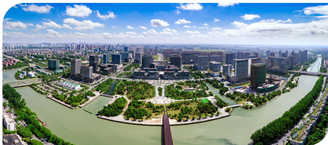
▲俯瞰国家级开发区嘉兴经济技术开发区

红船圣地,令人神往。5月29日至30日,全国85家主流媒体的136位总编、副总编、资深记者来到嘉兴,参加由中国晚报工作者协会、嘉兴市委宣传统战部主办,南湖晚报承办的“壮丽70年·奋斗新时代”全国晚报总编增强“四力”大型采访活动。本报作为中国晚报协理事务单位,受邀参加了此次活动。记者与大家一起走村入企,探寻当地高质量发展密码。由于亮点太多,无法一一列举,现仅选取三组数字及其背后的故事,以期展现嘉兴魅力,折射嘉兴巨变。