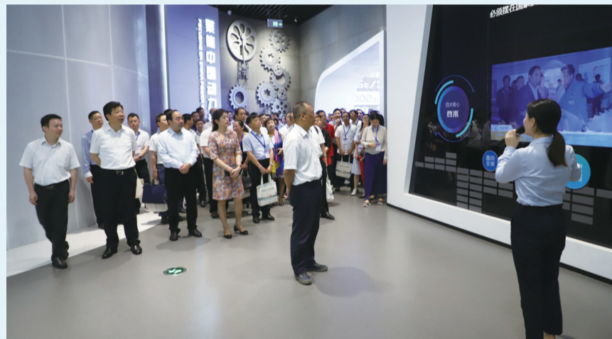
省、市领导及各参会嘉宾,参观中国动力谷,感受株洲创新成果。