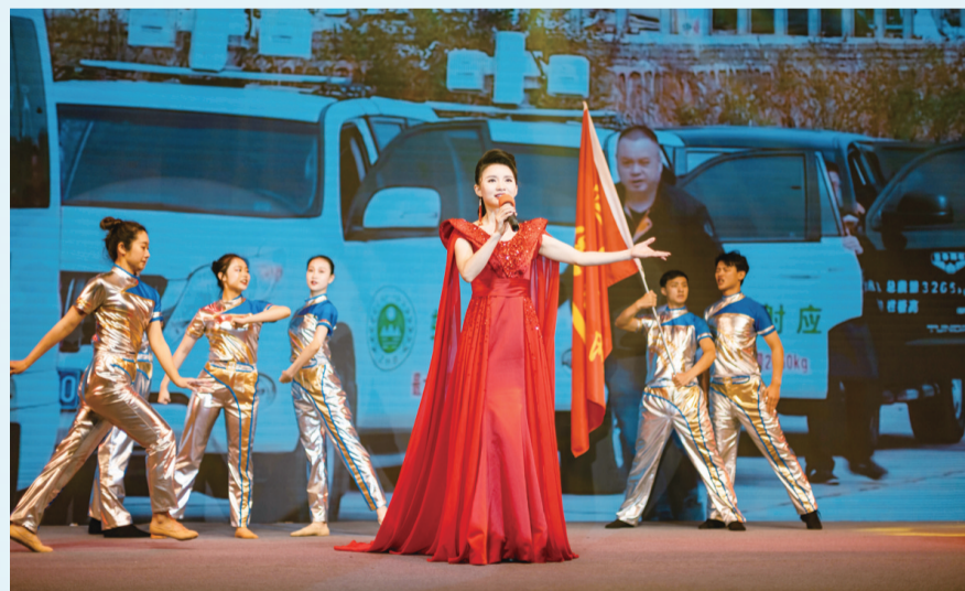
情景歌舞《环保铁军之歌》唱响了湖南环保人打赢污染防治攻坚战的信心、决心和气势。