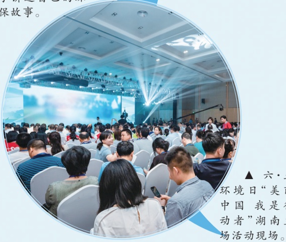
▲六·五环境日“美丽中国 我是行动者”湖南主场活动现场。