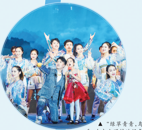
▲“绿草青青,鸟语花香,生态文明铸造绿色家乡……”歌曲《生态文明之歌》在活动现场唱响,以艺术形式传递生态文明理念。