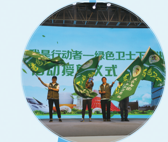
▲“美丽中国 我是行动者 绿色卫士下三湘”活动授旗起航。