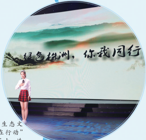
▲“生态文明 株洲在行动”演讲比赛中,选手讲述自己的环保故事。