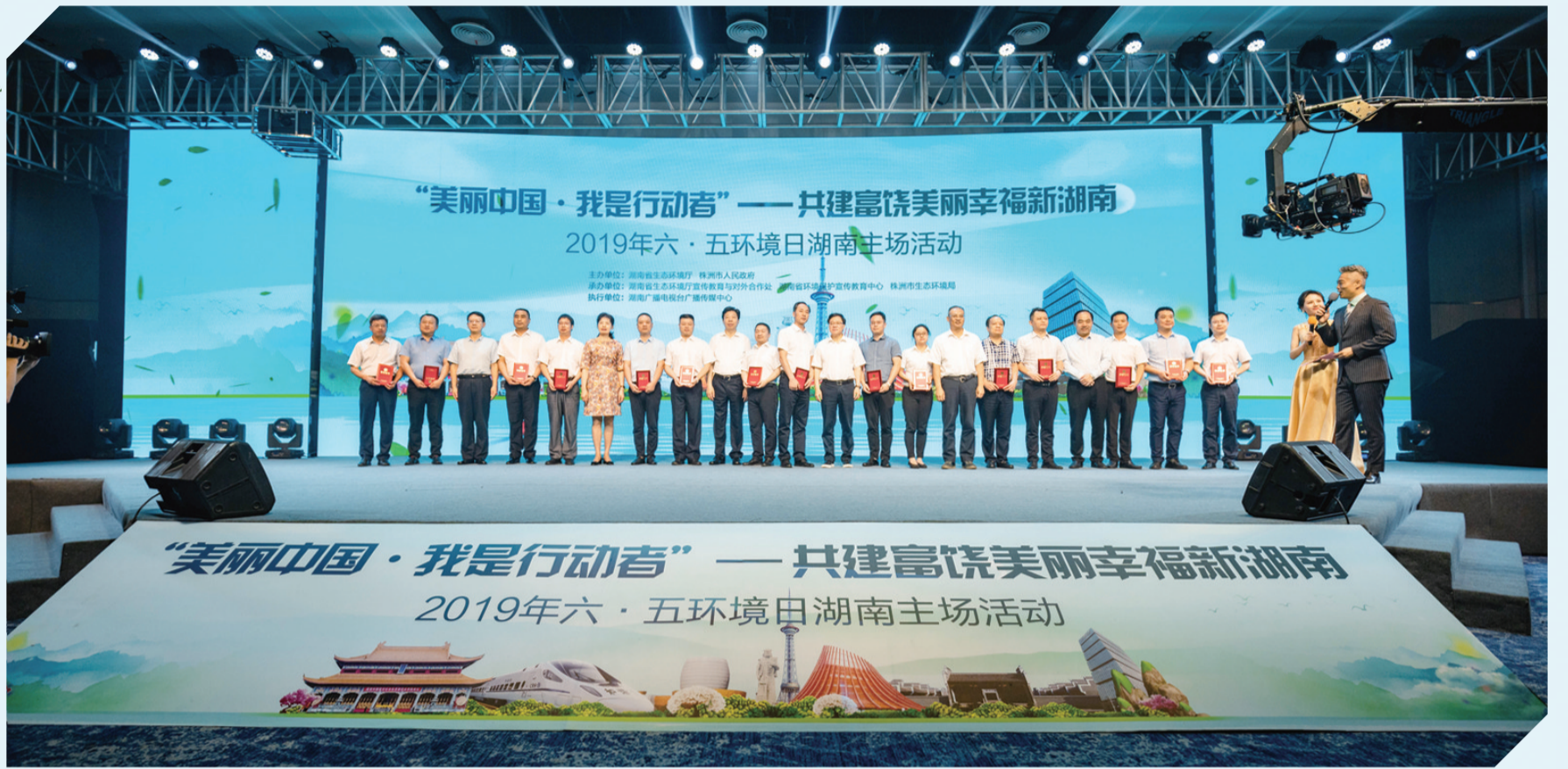
▲省市领导为全省首届“湖南最美基层生态环保铁军人物”颁奖。