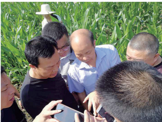
工作人员在田间处置虫害。

莲和玉米。玉米是头一年种,试验200亩,还请了省农科院专家做技术指导,不想“美洲来的虫啃了三分之一的玉米地”。