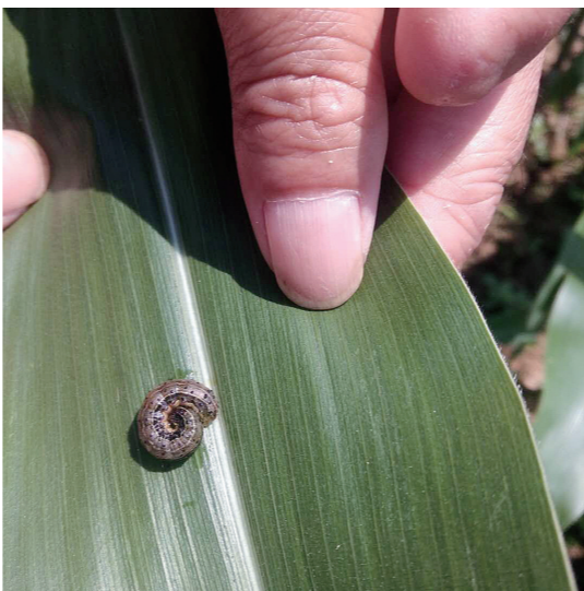
玉米叶上的草地贪夜蛾。