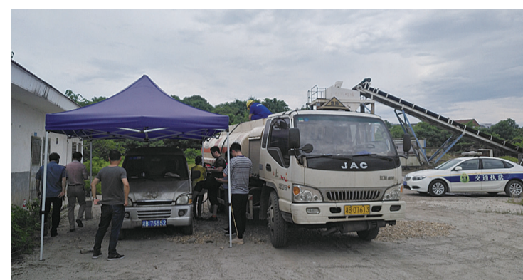
▲执法人员将非法加油点的油转运

本报讯(记者 肖捷 通讯员 刘志刚)昨日,攸县商务和粮食局联合公安、交通等部门联合执法,对藏在攸州工业园里一个非法加油点进行查处。昨日,执法人员接到群众举报,称有人在攸州工业园非法经营加油点。在检查过程中,执法人员发现一个废弃搅拌站里停着的一辆面包车十分可疑,打开车门一看,里面有一个装有汽