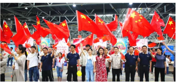
2000多人同唱《我和我的祖国》。

“这是我第一次来爸爸工作的地方,好漂亮啊!长大以后我也想来这里上班。”“老公平时工作忙,今天和女儿跟他一起来到他上班的地方,很震撼,觉得他工作虽辛苦但非常值得。”“北汽真是一个非常可爱的单位。有游戏、有美食,和家人一起很有意义。”谈起参加“家”年华活动,大家纷纷表示,这很幸福、很甜蜜,也很有意义。