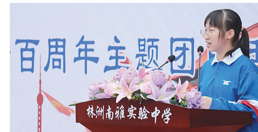
▲温馨积极参加学校活动

株洲南雅实验中学的校园里有一群优秀学子,他们有着行如立世的社会情怀,诠释着百年雅礼的光荣传统,代表了南雅学子的精神风貌。