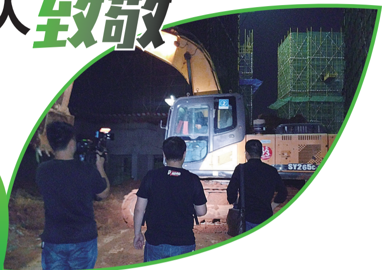
▲市环境监察支队打击夜间违规施工