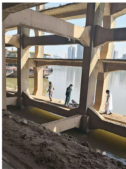
▲码头基架地形复杂,如何妥善转运落水者上救护车成了难题

昨晚7点,记者从省直中医院了解到,落水男子起初呈现半昏迷状态,意识不太清醒,经过一段时间的救治,逐渐恢复了意识,可以正常交流,其家人接到通知后也赶往了医院。经诊断,他除了呛水以外,没有明显外伤。