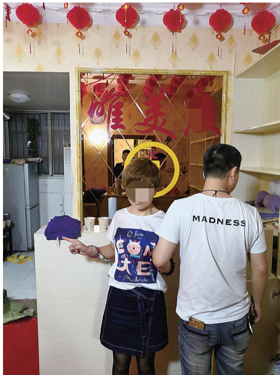
▲嫌疑人指认现场