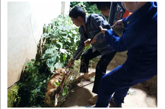
▲在消防员帮助下,小牛犊被成功拉了上来

消防员到场后,将坑洞周边的灌木清理干净,一名做好保护措施消防员降至坑内,将绳索套在小牛犊的四肢,大家很快把它拉了上来。由于坑洞内有近1米深的积水,小牛犊只是受了惊吓,没有受伤。