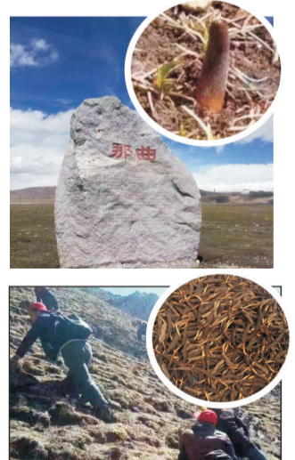
玉树 那曲真品虫草识别