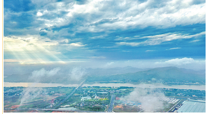
云中株洲,美不胜收。

云海之上的美景,原本也不属于我们手中的无人机。随着天气渐渐炎热,久暴雨后,会出现较低云层,无人机飞行的高度也可以穿越拍摄。日前,一阵大雨让株洲出现了低海拔云层,吸引了不少航拍爱好者用无人机穿越云海拍摄城市。用手机微信“扫一扫”功能扫码观看视频,带你穿越云层去看株洲,体验在城上空腾云驾雾的感觉。(文/唐剑华 视频剪辑拍摄/文可)