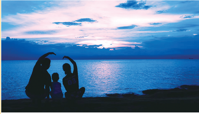
陪伴,是孩子成长最好的爱,也是世上最好的礼物。

加班、应酬、出差,爸爸们工作繁忙;上班、交际、家务,妈妈们也很辛苦。为了打拼的工作和事业,许多年轻父母们和他们的孩子,或演绎着双城甚至三城故事,或同在一个屋檐下,却没有时间彼此陪伴和交流。这个世界越来越开放,网络社交越来越活跃,我们慷慨的把时间留给陌生人,却没有时间来陪伴家人和孩子。