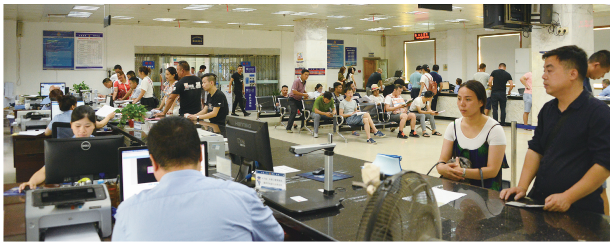
宽敞明亮的车管所办证大厅。

对大中型客货车驾驶证实现了省内异地申领。湖南省户籍的市民可以凭居民身份证在省内各地申领大中型客货车驾驶证,无需再提交居住证登记凭证。对户籍地在省(区)外的内地居民申请的,则需要审核居民身份证和本省(区)任一城市的居住证登记凭证;对持有本省(区)核发的港澳居民居住证的,只审核港澳居民居住证;对持有外省(区)核发的港澳居民居住证的,审核港澳居民居住证和公安机关核发的住宿登记证明。