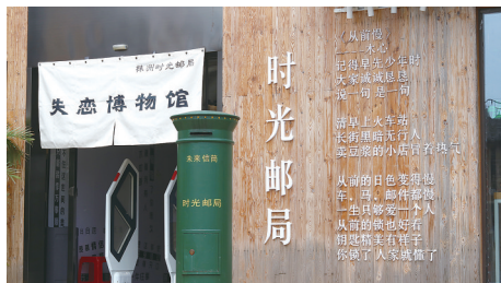
每一封泛黄的信件,都是一个故事。