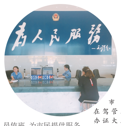
市民在车管所办证大厅办理业务。

摩托车检验“全国通检”。在已推行汽车全国通检的基础上,进一步放开摩托车跨省(区、市)异地检验。对注册登记6年以内的摩托车,免于到检验机构检验。同时,全面推行车辆购置税信息联网,实现车购税信息网上传递、网上核查。