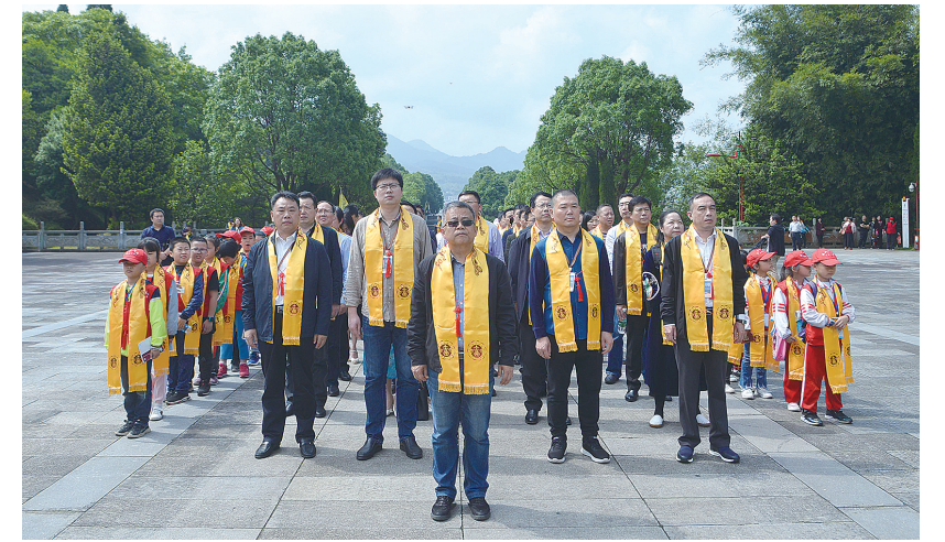
湖南报业百余媒体人祭祀神农始祖炎帝。

“壮丽70年奋斗新时代——美丽湖南·炎陵影像大赛”近日在株洲炎陵成功举行。来自全省的40家媒体、近百个媒体平台的100余位社长总编与记者编辑,肃立于炎帝陵举行祭祖仪式,祭祀神农始祖炎帝。